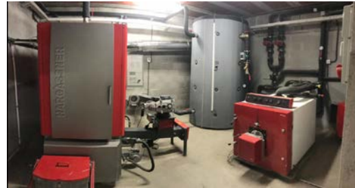
1303214 – WTH 200 Fecha PEM: Sep - 2014

Horas de funcionamiento: 53.503 (abril 2019) 6.000 h/año