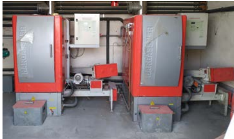
103927 – WTH 70 Fecha PEM: Nov - 2010

Horas de funcionamiento: 53.503 (abril 2019) 6.000 h/año