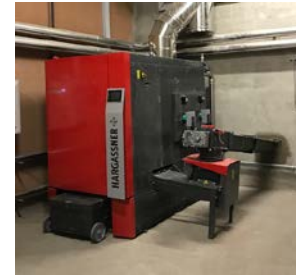
1705516 – ECO-HK 300 Fecha PEM: Dic - 2017

Horas de funcionamiento: Ampliación granja marzo 2018 con 28.593 35.390 (agosto 2019) 7.000 h/año